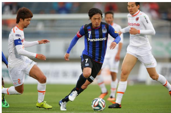
Jリーグ中継