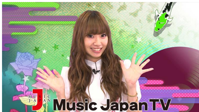
Music Japan TV